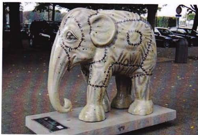
De Patchwork-olifant die op het Steenplein te Antwerpen stond en werd opgedragen aan 'Bring the Elephant Home'

Wil men het lot van tamme olifanten verbeteren, volstaat het echter niet om olifanten vrij te kopen, want dan vallen de eigenaars zonder inkomsten, wat ook niet de bedoeling is. Daarom lopen diverse projecten om de inwoners van traditionele 'olifantendorpen' andere bestaansmiddelen te geven, zodat ze niet meer met hun dieren gaan bedelen in de stad.