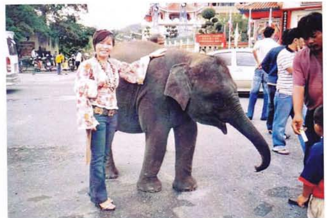
Wat is zulk een klein olifantje toch lief, maar... het hoort niet thuis op straat (foto G2)

Antoinette wilde het beseft doen groeien dat olifanten van de straat moeten. Er wordt met hen gebedeld, ze slapen naast