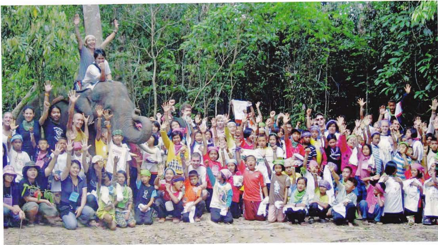
Deelnemers aan een 'boomplantkamp' in Thailand