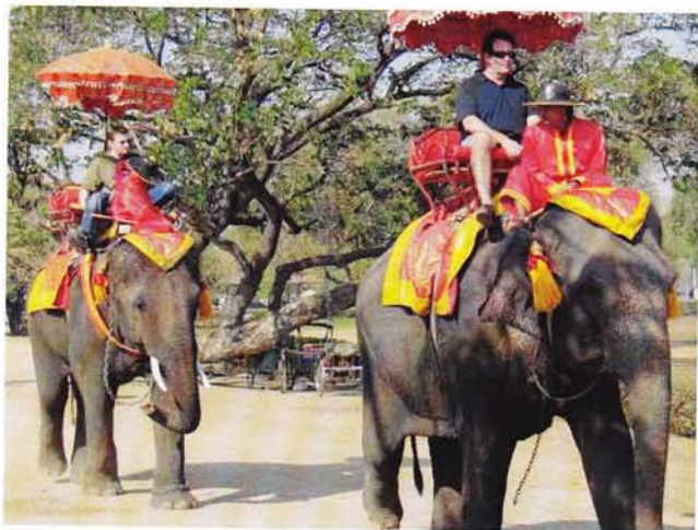
Mooi en statig, maar niet natuurlijk