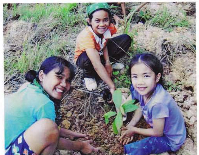
Bomen planten voor de olifanten

Bovendien is het met de wilde olifant in heel Azië erg gesteld. Leefruimte en voedsel voor olifanten zijn zodanig geslonken dat uitsterven dreigt. Hun natuurlijke habitat, het bos, staat onder zware menselijke druk en hun leefgebied geraakt versnipperd. De naar schatting 1.500 wilde olifanten die nog over zijn, komen vaak op landbouwgebieden terecht en zo ontstaan zware conflicten met de boeren. Iedereen die van veraf of dichtbij met deze situaties geconfronteerd wordt, weet dat er iets constructiefs voor deze dieren moet gebeuren, voor het te laat is.