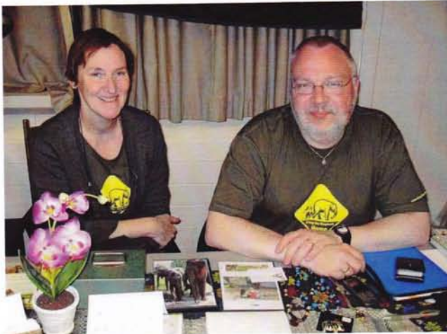
De stand van 'Bring the Elephant Home' tijdens het 'We love Thailand' evenement van Thaibel op 16 mei 2009